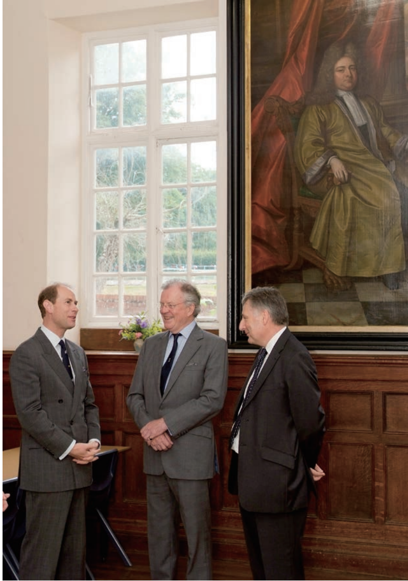
爱德华王子 (Prince Edward) 在创始人约翰的画像下追溯莱克顿学校的办学历史