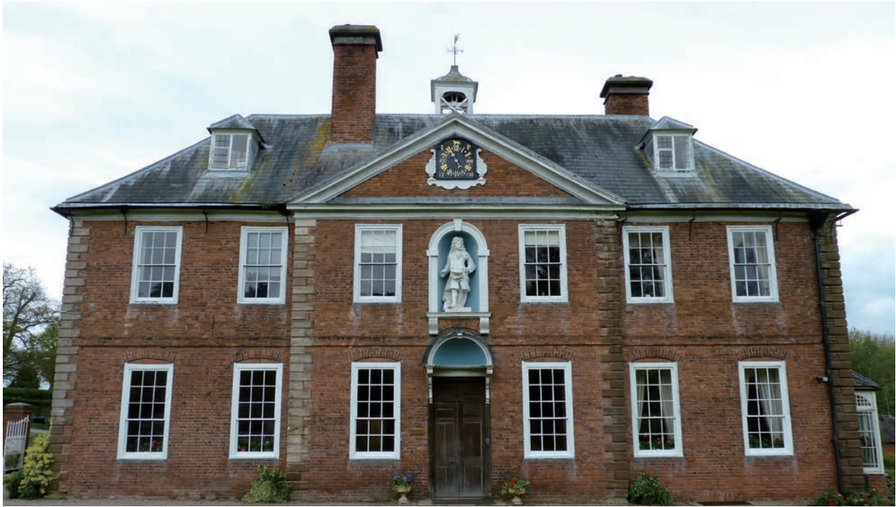
为纪念时任英国女王的安妮女王 (Queen Anne) 对莱克顿办学的支持, 学校具有 300 年历史的主楼被命名为安妮女王楼 (Queen Anne Building)